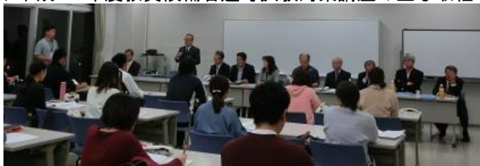
写真1 開講式 平成30年4月16日（月）