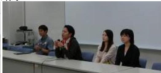
写真3 4教諭の体験講話4月16日（月） 今年度新規採用となった前年度本講座合格者