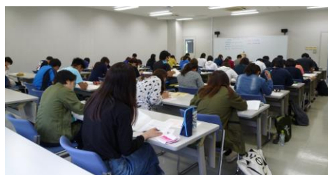
写真3 全国模擬試験4月21日（土）