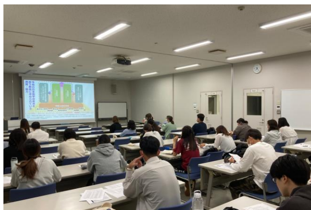
写真 4月10日(月)開講式